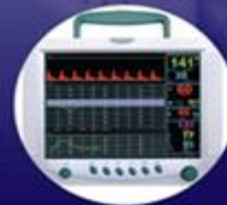
可攜式電子醫療裝備 Portable Medical Electronic Devices

其他相關規定請洽航空公司 內含鋰電池之空運貨物應向航空公司申報 交通部民用航空局 內政部警政署航空警察局