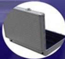
具有保全裝置之設備 Security-Type Equipment