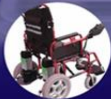
裝有鋰離子電池之輪椅或 其他電動行動輔助裝置 Wheelchairs/Mobility Aids with Lithium Batteries