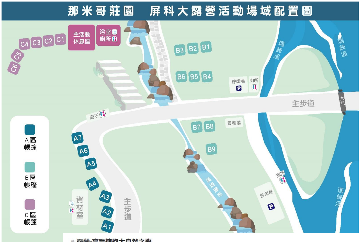
◎ 露營-享受擁抱大自然之樂